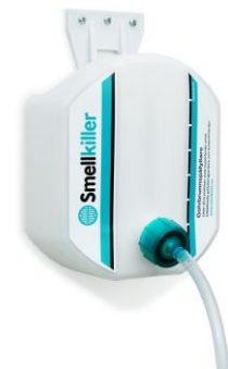
Smellkiller på vägg: