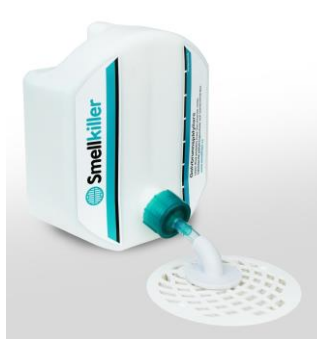
Smellkiller på golv

Har du monterat allt rätt kommer Smellkiller att släppa ut vatten då vattennivån i brunnen ligger under slangens mynning.